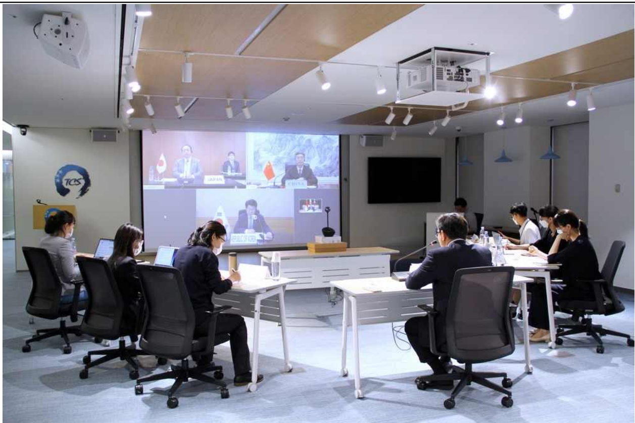
한중일 교통물류장관회의 특별세션('20.6.29)