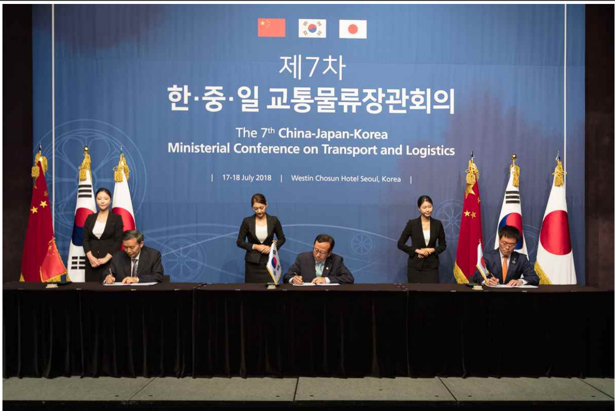
제7차 한중일 교통물류장관회의(공동선언문 서명 / '18.7.18)